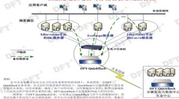
安徽定远供电公司存储备份系统拓扑图